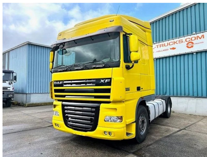
DAF XF 105.460 SPACECAB WITH HYDRAULIC KIT (... 4x2 Referentienummer: SN 54724692