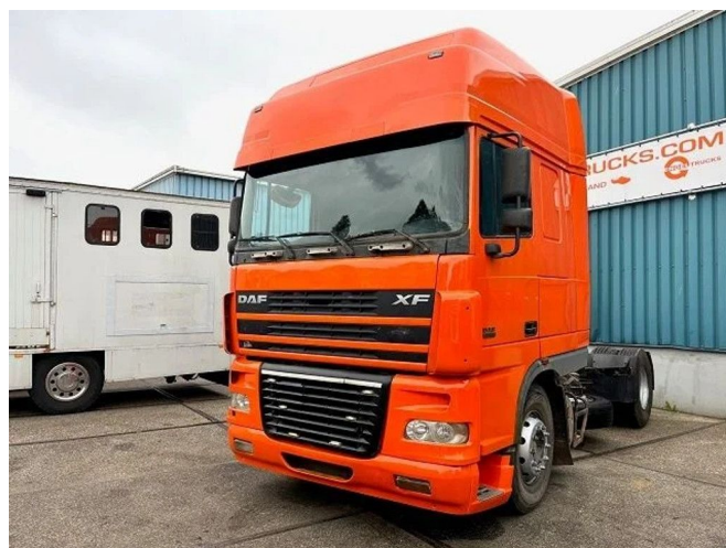
DAF XF 95-430 SUPERSPACECAB (EURO 3 / ZF16 M... 4x2 Referentienummer: SN 55506560 Z