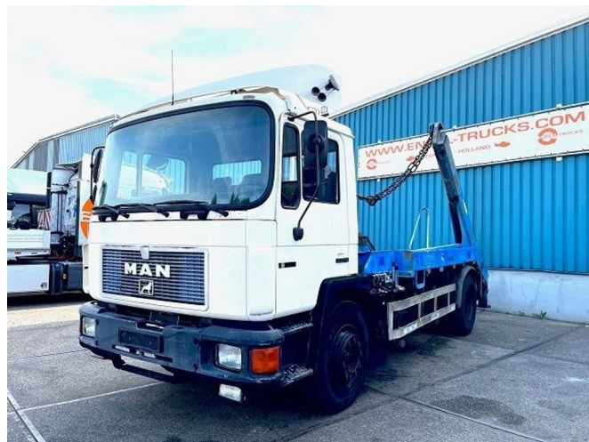
MAN 18 .232 (6 CILINDER) M90 WITH TELESCOPIC ... 4x2 Referentienummer: SN 55609062

• Boîte à outils • Différentiel d'écartement • Limiteur de vitesse • Lumières vives • Prise de force • Prise de force (PTO) • Radio / lecteur CD • Rétroviseurs extérieurs à réglage électrique • Spoiler de toit