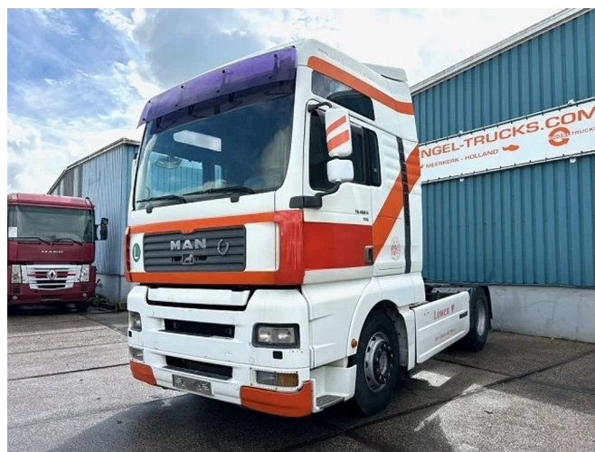
MAN TGA 18.460 FLS XXL (6 CILINDERHEADS!!) (ZF1... 4x2 Referentienummer: SN 56429608