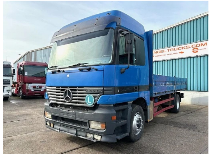
Mercedes-Benz Actros 1840 L (MP1) 4x2 STEEL-AIR SUSP...