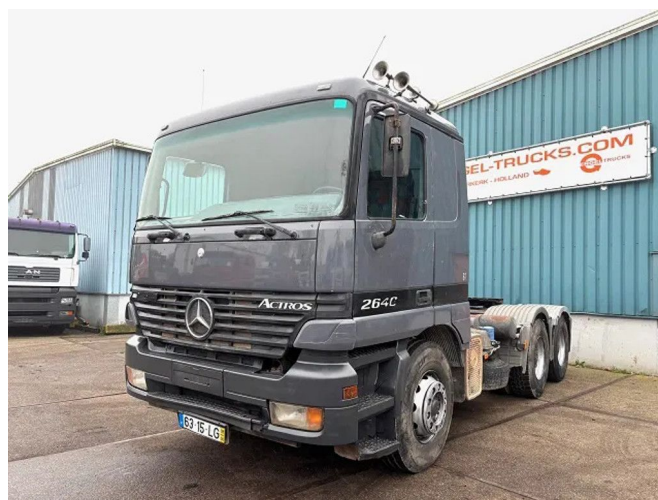
Mercedes-Benz Actros 2640 S 6x4 FULL STEEL TRACTOR ...