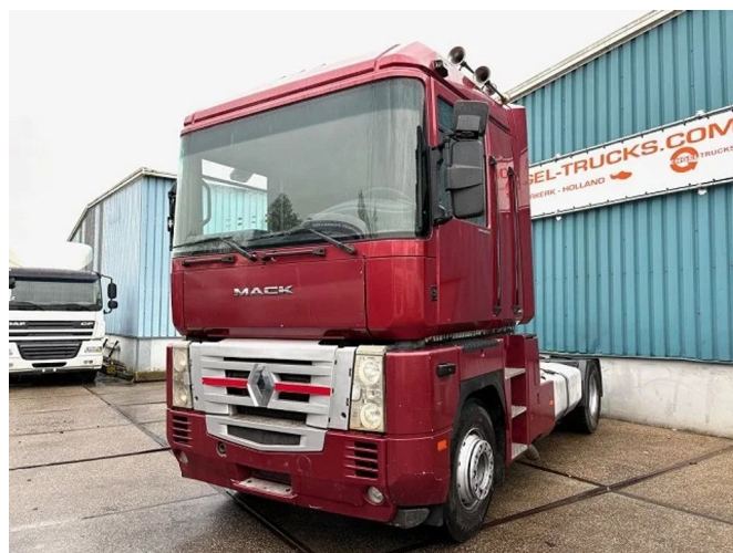
Renault Magnum 440 E-TECH (EURO 3 / ZF16 MANUA... 4x2