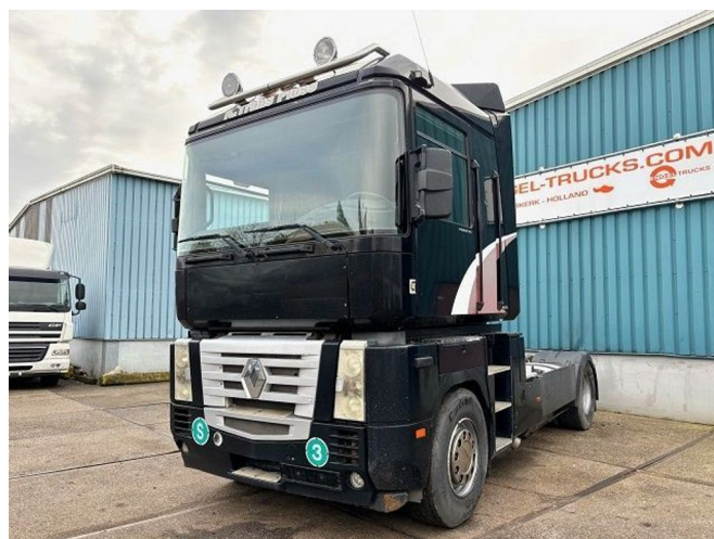
Renault Magnum 480 (E-TECH) PRIVILEGE (ZF16 MA... 4x2