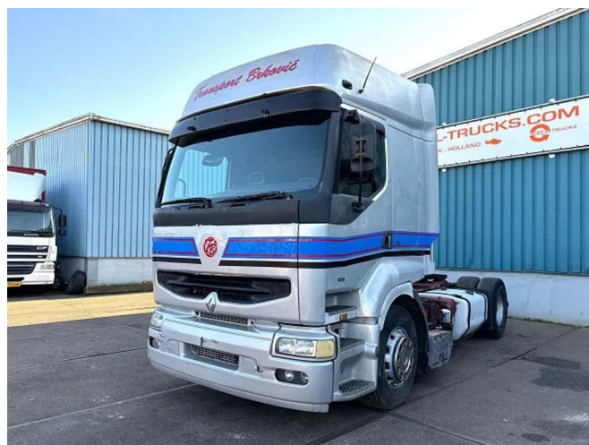
Renault Premium 400 .18T ROUTE 4x2 (POMPE MANUELLE...