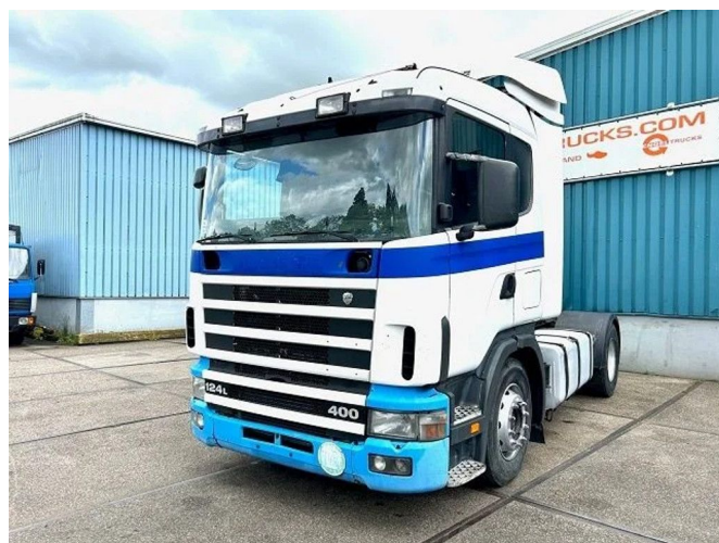
Scania R124-400 L 4x2 SLEEPERCAB ADR/VLG (2 FUEL LI...