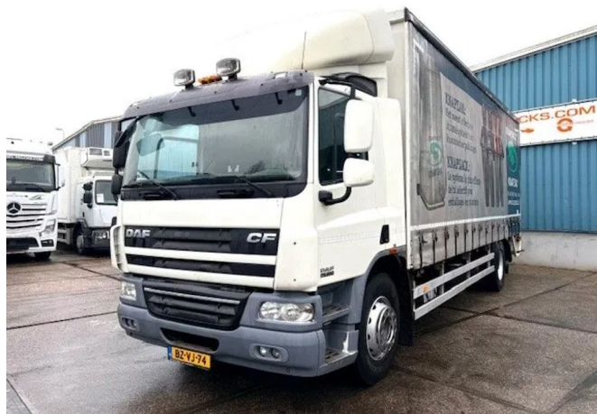
DAF CF 75.250 4x2 WITH CURTAINSIDE BOX & LOADING ...