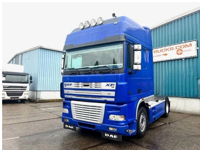
DAF XF 530 SUPERSPACECAB 4x2 TRACTOR UNIT (EURO...