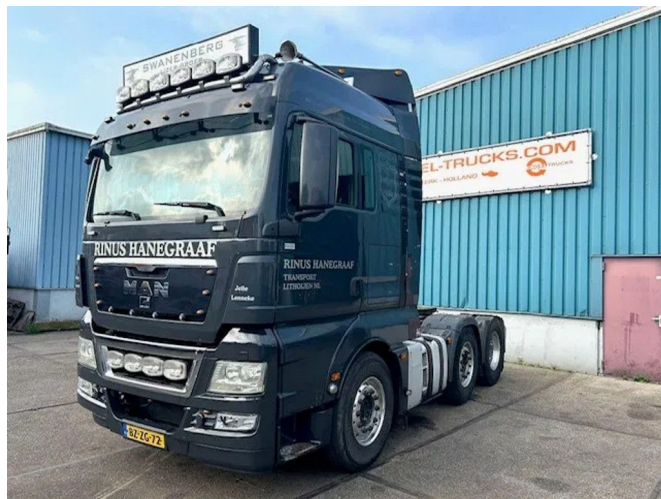
MAN TGX 26.480BLS XLX 6x2 (ZF16 MANUAL GEARBOX / ...