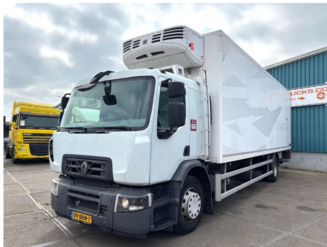
Renault D 19 D320 SLEEPERCAB 4x2 LAMBERET / THER...