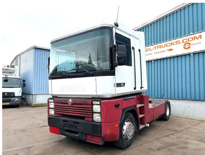
Renault Magnum 430 PRIVILEGE (ZF16 MANUAL GE... 4x2